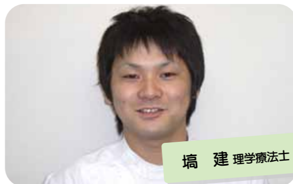
埜 建 理学療法士

明生リハビリテーション病院に入職してから、あっという間に4ヶ月が経ちました。入職当初は緊張と不安でいっぱいでしたが、現在では徐々に仕事にも慣れ少しずつ余裕を持てるようになってきました。休日には同僚と食事に出掛けたり旅行をするなど、プライベートも充実しています。今後はさらに技術を磨き、患者様により良いリハビリテーションを提供できるよう努力していきたくと思います。